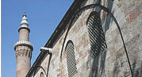
Ulu Cami (Great Mosque), Bursa, Turkey, 1400

Bursa's Ulu Cami (Great Mosque) is at the western end of Atatürk Caddesi (the main city-center boulevard) in Bursa's city center, a great big stone box topped by 20 domes.