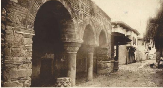
Hacı Özbek Camii, Iznik, Turkey, 1334

The Hacı Özbek mosque, according to the inscriptive plaque (kitabe) above a window, was built by when Hacı Özbek bin Muhammed in 734 A.H, three years following the conquest of Iznik by Orhan I Source: http://archnet.org/sites/2034