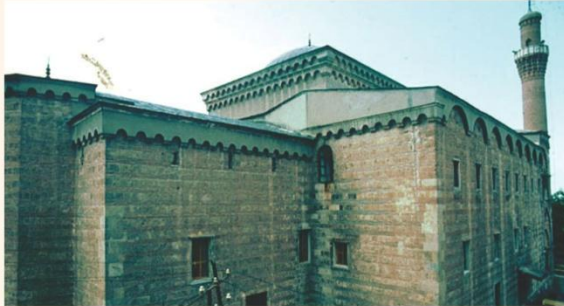
Murad Hüdavendigâr Camii, Bursa, Turkey, 1382

Exterior view of the mosque, from southeast, showing the heavy walls of the building from the apex of the mihrab on the right to the foundations of the minaret on the left